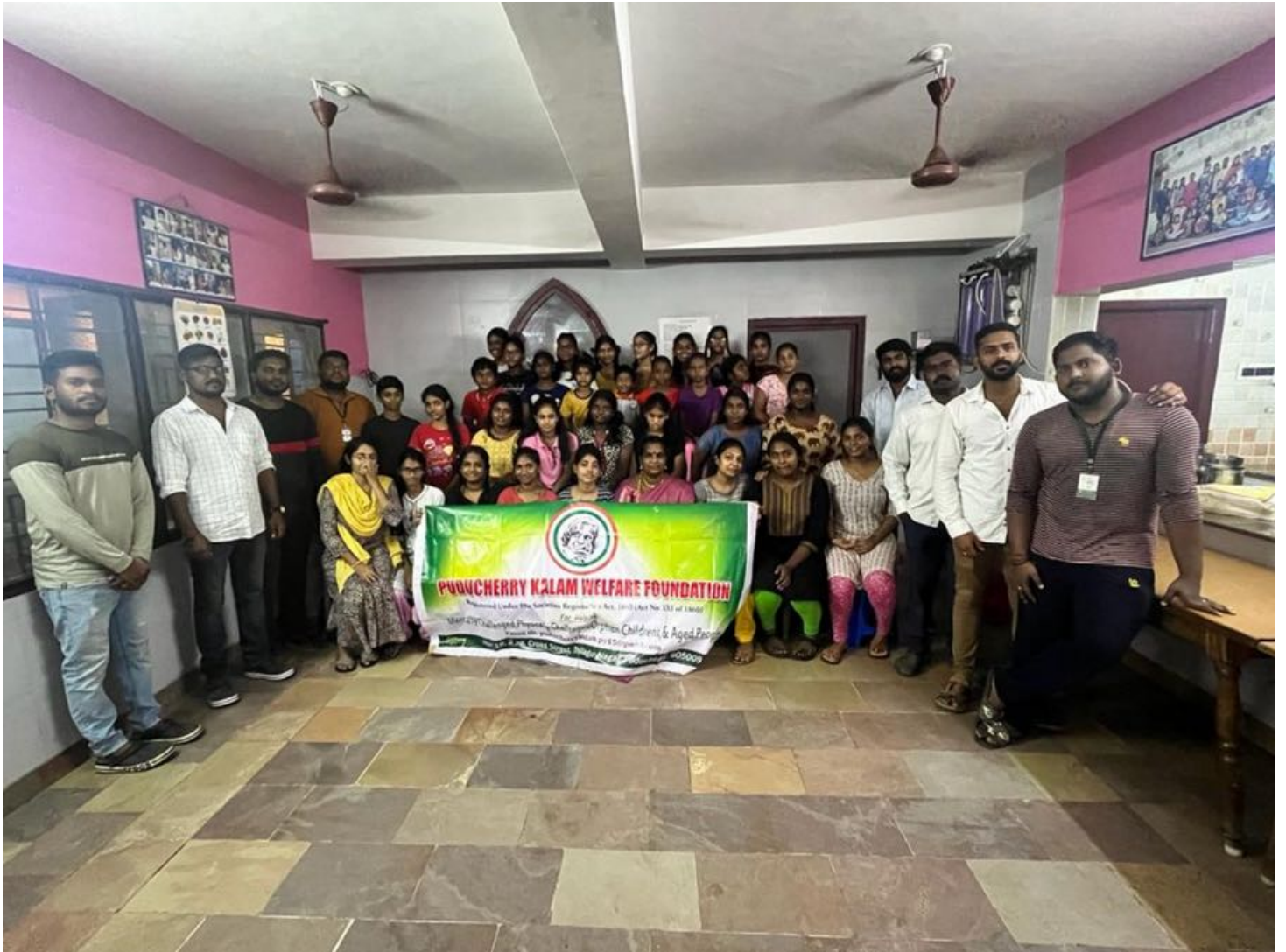
PHOTO SOUVENIR D'UN GROUPE DE JEUNES VOLONTAIRES INDIENS QUI FONT DES ACTIVITÉS ET DES SORTIES AVEC LES ENFANTS DEPUIS 6 ANS